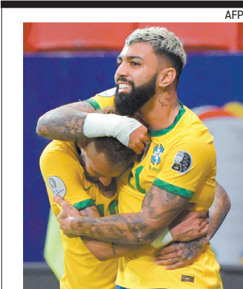
Gabigol e Neymar: juntos