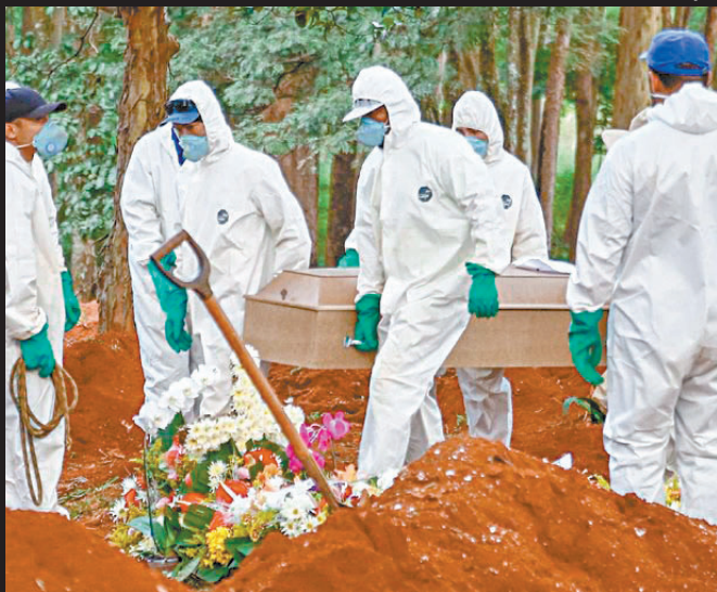
POPULAÇÃO SEM VACINA