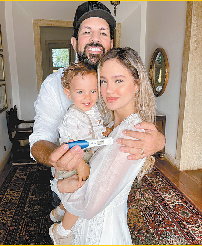
DIVULGAÇÃO / CG COMUNICAÇÃO

■ ‘Um Café Lá em Casa’ é o nome do programa apresentado pelo guitarrista Nelson Faria em um canal no Youtube como o mesmo nome. A atração terá nova temporada a partir desta quinta-feira (1), às 11h com ass participações de Oswaldo Montenegro, Lenine, Lô Borges, Ellen Oléria, entre outros artistas