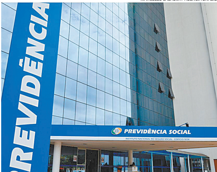
A pessoa deve usar os canais oficiais para cumprir solicitação do INSS

— sempre que o INSS convoca o cidadão para apresentar documentos, essa convo-