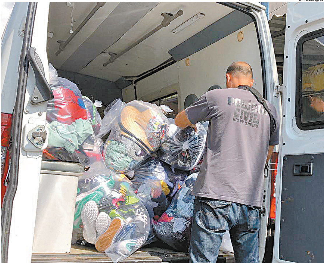
Entre os presos está um miliciano foragido da Justiça do Rio apontado como o responsável por extorsões

Contra ele havia mandado de prisão por extorsão mediante sequestro. Outro homem apontado como o executor da milícia também foi capturado. Durante a operação, agentes interditaram depósitos de gás clandestinos, lojas de roupas que servem para lavagem de dinheiro da milícia e salas usadas para distribui-