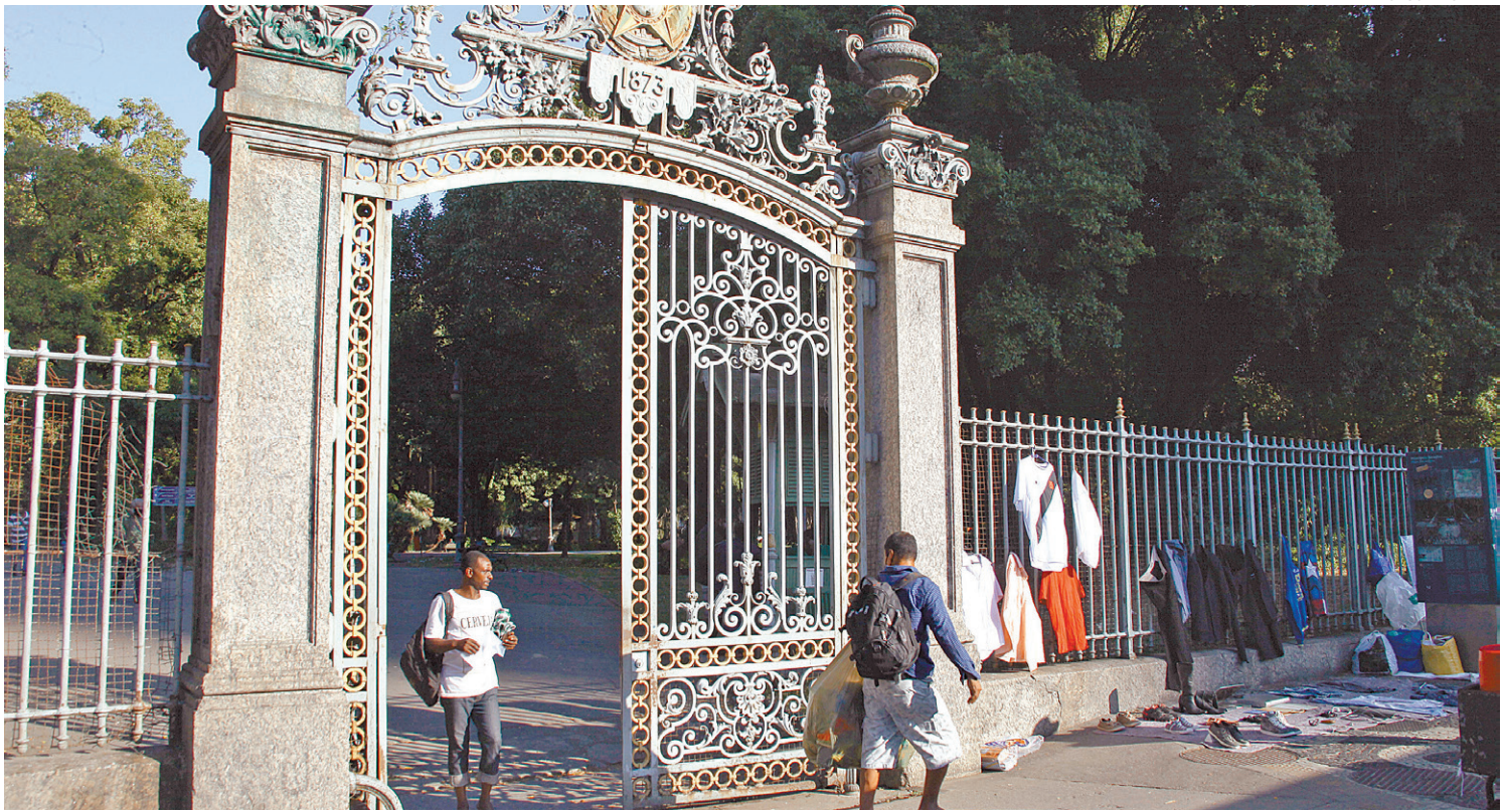
Além da depredação das ponteiros do gradil, o Campo de Santana, no coração do Centro, tem lixeiras quebradas e até fiação exposta

Segundo um ambulante que trabalha em uma das