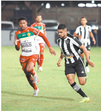
Botafogo sofre na Série B