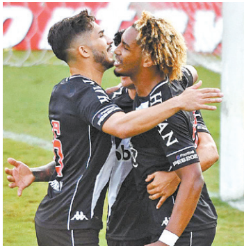
Jogo é às 16h em São Januário

De olho no G4, o Vasco quer fazer mais uma vez o dever de casa nessa Série B. Hoje, às 16h, o Gigante da Colina irá medir forças com o líder Náutico, invicto na competição e com uma rodada de folga na liderança. Após a partida burocrática contra o Coritiba na última terça, no Couto Pereira, a equipe de Marcelo Cabo precisará se impor ainda mais, já que irá encarar a melhor defesa da Série B. No sistema defensivo, se as jogadas de bola aérea são um terror para a equipe Cruz-Maltina, o ajuste terá de acontecer. O Náutico é o melhor atacante da competição e a equipe que mais assusta em jogadas